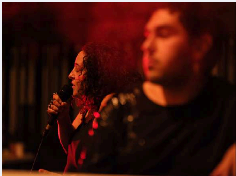
Résidence au TPM - Théâtre Public Montreuil, décembre 2025