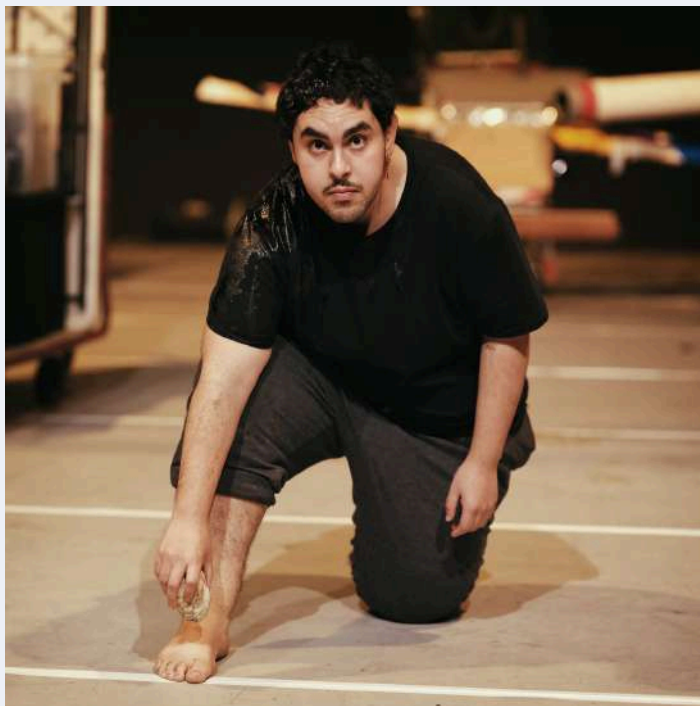
Résidence au TPM - Théâtre Public Montreuil, décembre 2025

*Le titre est construit autour du mot « seum », qui vient de l'arabe et signifie « venin ». En argot, « seum » est utilisé pour désigner colère, frustration et amertume. Le titre fait aussi référence à la traduction phonétique du livre d'Octavia Butler, "Parable of the Sower", traduit en français par « La Parabole du Semeur », très proche dans sa sonorité avec le mot « seum ».