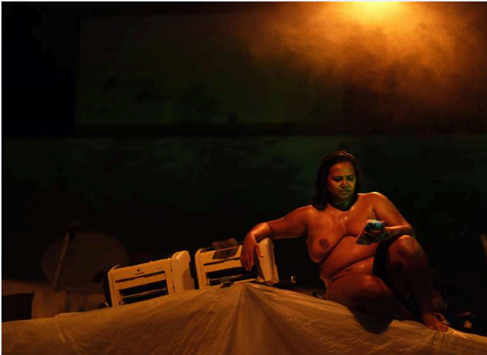
Résidence au TPM - Théâtre Public Montreuil, décembre 2025