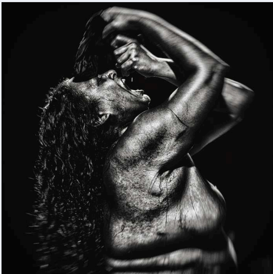
Résidence au TPM - Théâtre Public Montreuil, décembre 2025