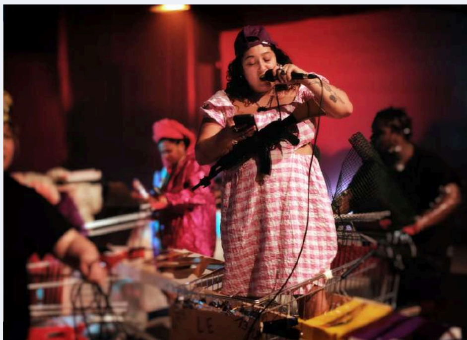
Résidence au TPM - Théâtre Public Montreuil, décembre 2025

Au moment de créer Carte noire nommée désir , je voulais politiser l'intime sans aller vers le documentaire, utiliser le théâtre pour fabriquer des images qui n'existaient pas, un imaginaire dont les personnes racisées pourraient être fières, sans pour autant gommer la violence qui nous permettait d'en arriver à ces représentations. Ça a donné une esthétique non linéaire, non narrative, ce qui était ma façon d'aller vers le futur, vers le fantastique. Dans mon prochain spectacle, je voudrais assumer mon amour de la fiction, né entre autres de la découverte d'œuvres de science-fiction écrites par des femmes ou des personnes trans afro-américaines ou britanniques, comme Nnedi Okorafor, Octavia Butler, Rivers Solomon, Ketty Steward... Sans imaginer que ce sera spectacle entièrement fictionnel, j'ai l'intuition que ça va sans doute me mener vers d'autres explorations esthétiques.